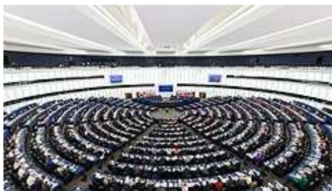
Sala obrad Parlamentu Europejskiego