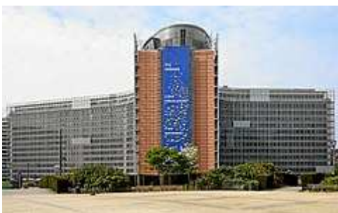
Siedziba Komisji Europejskiej